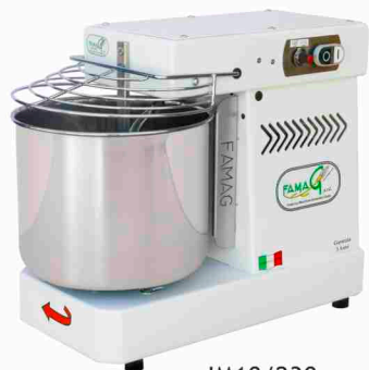
IM8/230 10 velocità IM10/230 10 velocità