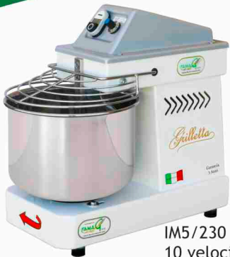
IM5/230 10 velocità